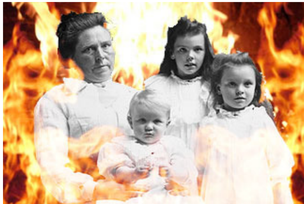
Belle Gunness và các con.