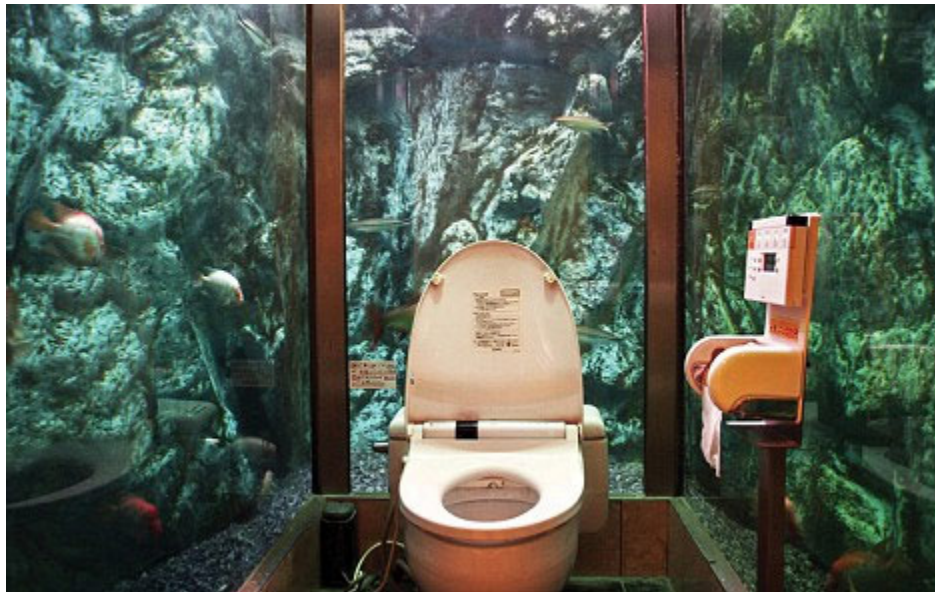
Thong thả ngắm cá bơi từ nhà vệ sinh.