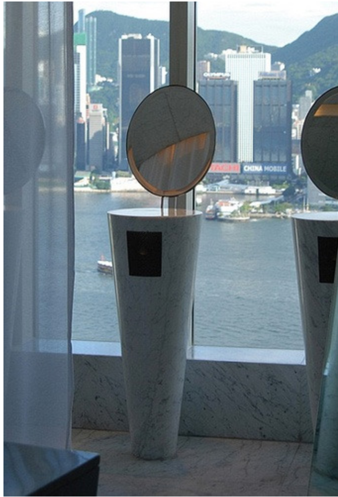
Ngắm cảnh thành phố qua vách kính của WC.