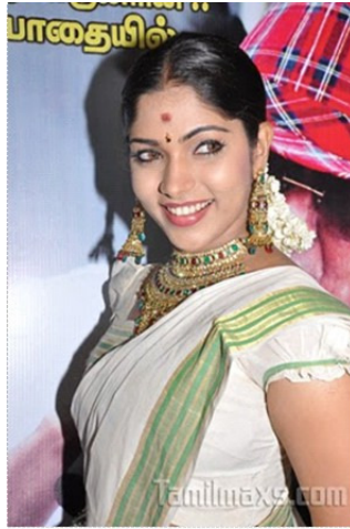
Shanti Devi ở tuổi trưởng thành

Câu chuyện có thật về cô bé Shanti Devi đã một thời chấn động toàn thế đất nước Ấn Độ. Những tờ báo lớn, đài phát thanh, các phái đoàn khoa học quốc tế ngày đó, thậm chí cả Thủ tướng Mahatma Gandhi, Thánh Ghandi cũng đã từng đích thân tới gặp mặt Shanti hỏi chuyện.