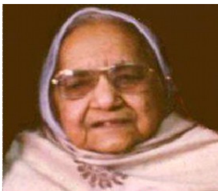
Shanti Devi khi về già

Được biết suốt đời Shanti sống độc thân không lấy chồng cho đến ngày nhắm mắt. Bà mất ngày 27/12/1987, hưởng thọ 61 tuổi.